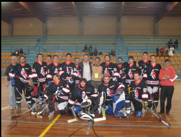
Ghosts prima squadra

La prima Squadra della Stagione 2007/08 sta ben figurando in Serie A2 con elementi molto giovani e promettenti.