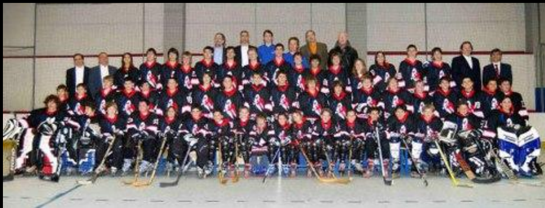
Ghosts – gruppo giovanili